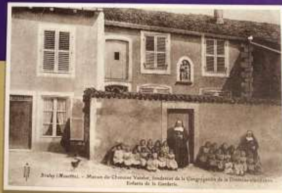
Carte postale de l'ancienne école de Bruley